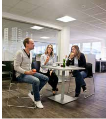
Informeller Austausch unter Kollegen