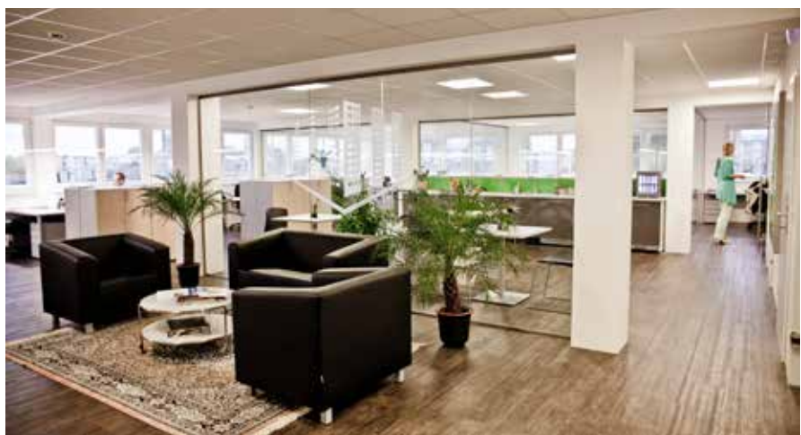
Offene helle Räume in der neuen Zentrale von Bauchinger.

Die moderne Arbeitswelt geht heute klar in Richtung einer flexiblen Arbeitsorganisation, die von formellem und informellem Austausch unter den Mitarbeitern geprägt ist. Mit den neuen Räumen will Bauchinger dem Rechnung tragen. Die Schaffung von Kommunikations- und Konzentrationszonen führt dazu, dass man sich freier bewegen kann und situationsbedingter handelt. Mehr Bewegung führt automatisch auch zu mehr Flexibilität in der Arbeitsweise. So ist das Arbei-