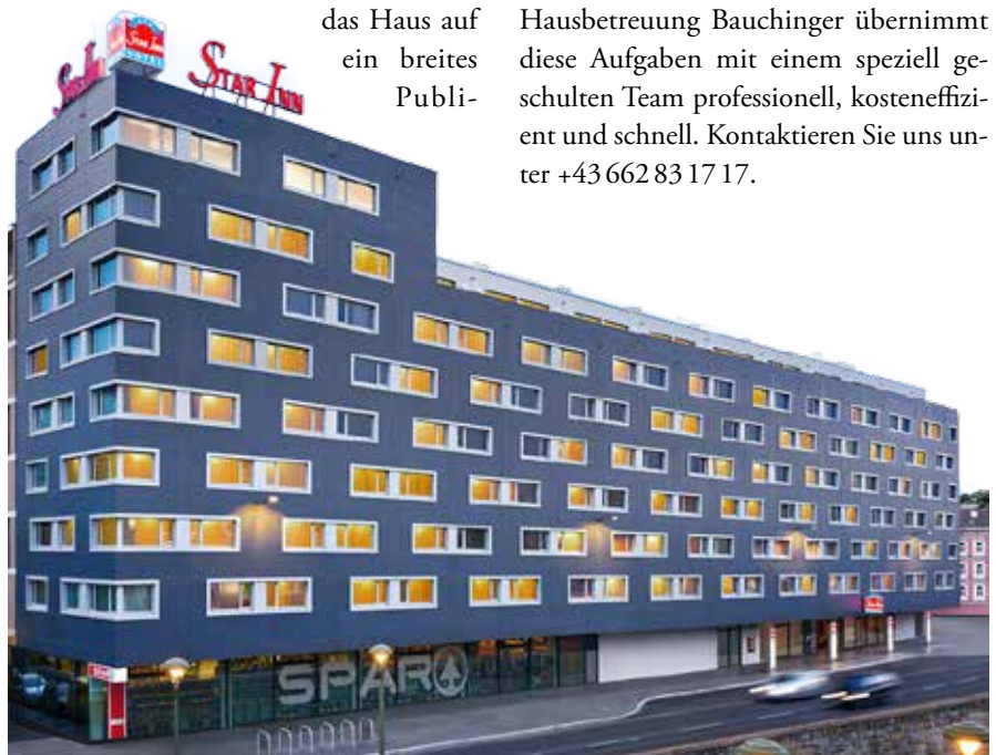
Housekeeping-Service für das Star Inn Hotel „Schönbrunn“ in Wien.

kum eingestellt. Sowohl Geschäftsreisende als auch Familien fühlen sich dort wohl. Dazu tragen unter anderem die Mitarbeiter des Housekeeping-Service von Hausbetreuung Bauchinger bei. Sie sorgen im Star Inn Schönbrunn für Sauberkeit und Ordnung. Hausbetreuung Bauchinger übernimmt diese Aufgaben mit einem speziell geschulten Team professionell, kosteneffizient und schnell. Kontaktieren Sie uns unter +43 662 83 17 17.