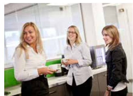
Beliebt: die Mitarbeiter-Cafeteria