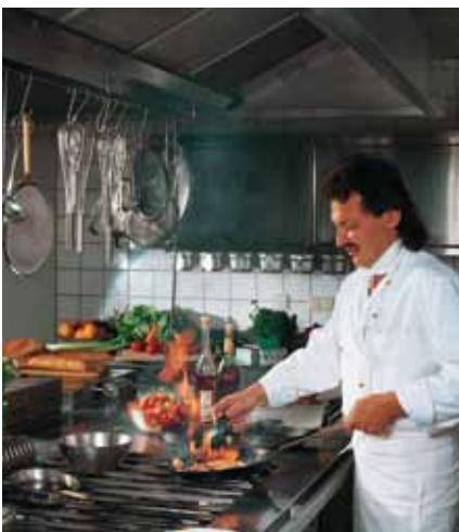
Gründliche Hygiene im Küchenbereich

Die Stiegl-Ambulanz verbindet innovatives Design mit echter Salzburger Gemütlichkeit. Dazu wird moderne Hausmannskost mit ausgesuchten Zutaten aus der Region serviert – natürlich mit und zu Bier.