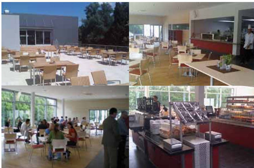
Das neue Restaurant von Mercedes Benz in Salzburg.

Diese Zusammenarbeit mit SV Österreich, bei der in vernetzten Dienstleistungen gedacht und gearbeitet wird, zeichnet uns als Lösungsanbieter aus. Unser gemeinsames Ziel sind langjährige Partnerschaften, in denen wir uns gemeinsam mit unseren Kunden und ihren Gästen weiterentwickeln. Wir setzen auf individuel-