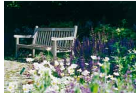
Ein schöner Garten entspannt.

Ein dichter Rasen wird durch den regelmäßigen Rasenschnitt erzielt. Je nach Notwendigkeit wird anschließend vertikutiert. So werden dem Rasen mehr Nährstoffe zugeführt und die Rasenfläche sieht frischer, gesünder und gepflegt aus. Professionell gestaltete und gepflegte Grünbereiche sind das Aushängeschild der Liegenschaft, die von jedem Passanten wahrgenommen werden, und somit auch zum Firmeneindruck