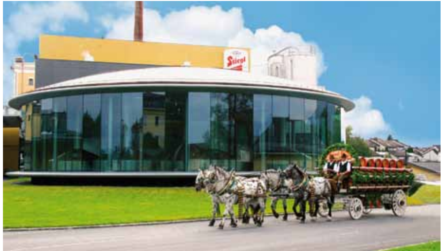
Der traditionelle Pferdewagen von Stiegl vor dem neuen Sudhaus.

Grundstein für diesen Erfolg ist neben modernster Technik und dem Bekenntnis zu einem Braustandort in der Stadt Salzburg vor allem die Tatsache, dass Bierbrauen bei Stiegl noch Handwerk mit mehr als 500 Jahren Erfahrung ist – Braukunst eben. Dabei hat Stiegl stets auf den Weg der besten Qualität gesetzt. Sei es bei der strengen Auswahl der österreichischen