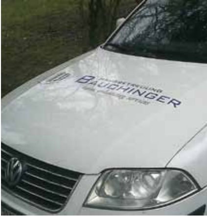
GPS optimiert die Routenplanung des Fuhrparks von Hausbetreuung Bauchinger.

Hausbetreuung Bauchinger hat alle Einsatzautos mit einem Fahrzeugortungs-System ausgestattet. Eingesetzt wird es zum Controlling und zur Optimierung der Abläufe im gesamten Fuhrpark. Durch diese Blackbox weiß das Team sofort, wo sich die Fahrzeuge befinden und welcher Mitarbeiter am schnellsten beim Kunden sein kann. Mit dem neuen System wird die Effektivität der Bauchinger-Fahrzeugflotte gesteigert und der Außendienst unterstützt. Touren können rechtzeitig geplant und optimiert werden. Die Routenplanung ermöglicht eine Zeitersparnis, die Hausbetreuung Bauchinger dann mehr