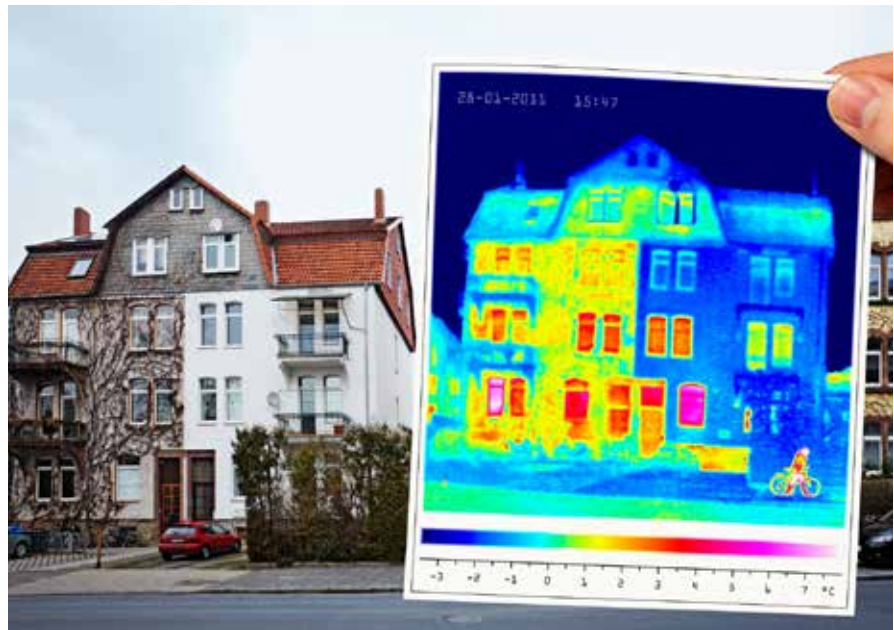
Häuser werden mit der Wärmebildkamera untersucht, um Schwachstellen zu finden.

Schon seit einigen Jahren muss man bei Verkauf und Vermietung einen Energieausweis vorlegen. Lasche Regelungen und eine Fülle von Ausnahmen haben aber dazu geführt, dass diese Praxis nur halbherzig erfolgte. Das hat sich jetzt geändert.