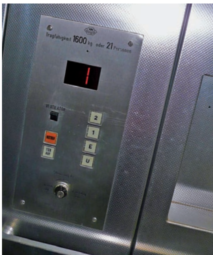
Hausbetreuung Bauchinger bietet einen Notruf-Service für Aufzugsanlagen.

Technische Innovationen machen Maschinen intelligenter, schneller und präziser. Über die Gebäude-Fernüberwachung können sie sogar miteinander kommunizieren. Dabei werden Daten und Messwerte zwischen den einzelnen Systemen vollautomatisch ausgetauscht. Hausbetreuung Bauchinger nutzt diese fortschrittliche Technik und verwendet sie seit Längerem erfolgreich als Bindeglied zwischen dem Telefonnetz und der Elektroinstallation. Mit dem Telecontrol-Gerät werden wichtige unterschiedliche Funktionen vereint. Es ist nämlich Kontroll-, Steuer-, Alarm- und Wählgerät in einem. Beim Auftreten eines akuten Problems erfolgt sofort eine automatische Warnung. So kann man rasch die verschiedensten Defekte erkennen, zum Beispiel ein Problem der Heizungspumpe, der Sumpfpumpe, einen Abfall des Wasserdruckes